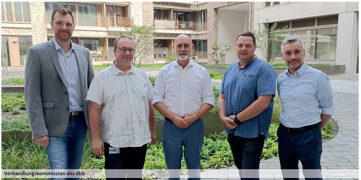
Verhandlungskommission des dbb

gehen oder ihre Arbeitszeit zu reduzieren. Dem demografischen Wandel kann nicht durch eine immer längere Arbeitszeit, sondern nur durch motivierte und gesunde Beschäftigte entgegengetreten werden. Darüber hinaus sollte Mobilität immer nachhaltig gestaltet werden. Im Rahmen eines zukunftsweisenden und fortschrittlichen Gesundheitsmanagements muss das Thema Fahrradleasing auch bei der Autobahn GmbH angegangen werden.“