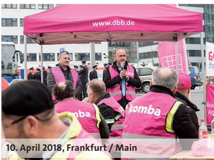
10. April 2018, Frankfurt / Main

Auch die Beschäftigten der Fraport AG, vom Flughafen München und vom Flughafen Köln / Bonn sind dem Streikaufruf des dbb gefolgt und haben am 10. April 2018 ihre Arbeit niederge-