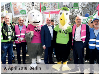
9. April 2018, Berlin

Mehr als 1.000 Beamte und Angestellte haben am 9. April 2018 in Berlin für ihre Forderungen demonstriert. Die Beschäftigten haben mit ihrem Demonstrationzug vom Haus der Vereinigung der kommunalen Arbeitgeberverbände (VKA) zum Bundesfinanzministerium dem dbb Verhandlungsführer Ulrich Silberbach lautstark den Rücken gestärkt und vor einem Scheitern der Verhandlungen gewarnt. Silberbach beklagte vor allem die Uneinsichtigkeit der kommunalen Arbeitgeber: „Jeden Tag hört man von Rekordeinnahmen und steigenden Überschüssen bei den Kommunen. Gleichzeitig sollen die Kolleginnen und Kollegen Zurückhaltung üben