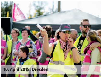
10. April 2018, Dresden