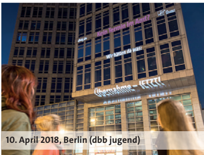
10. April 2018, Berlin (dbb jugend)