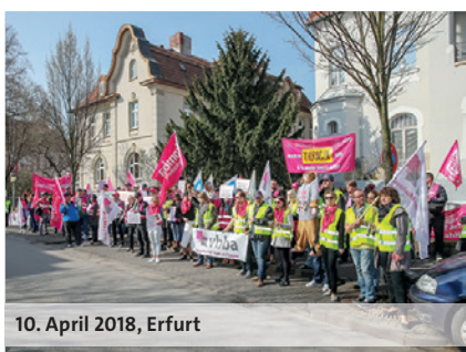
10. April 2018, Erfurt