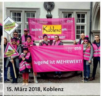
15. März 2018, Koblenz