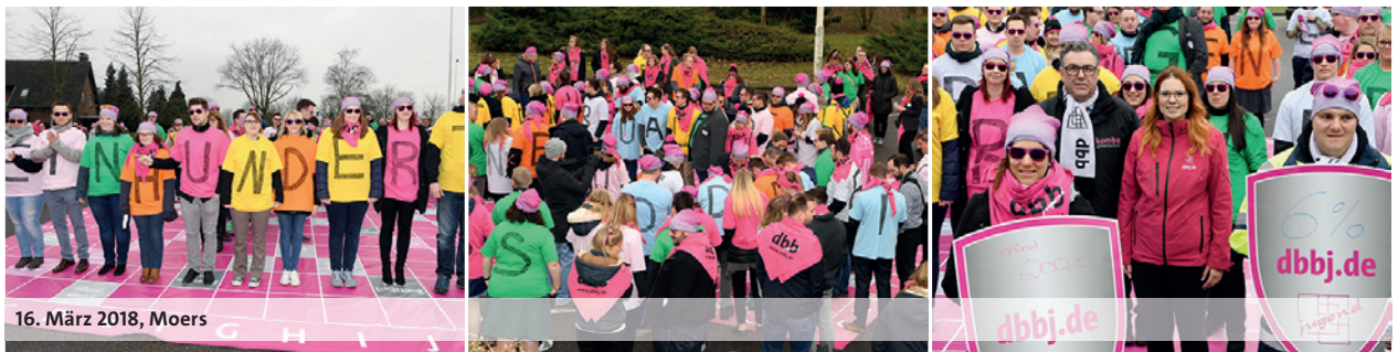
16. März 2018, Moers