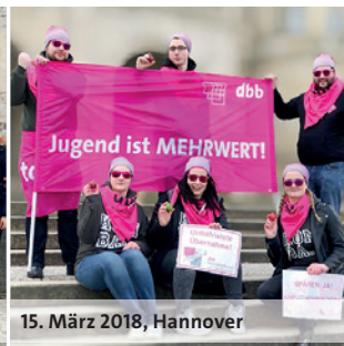
15. März 2018, Hannover