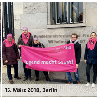
15. März 2018, Berlin