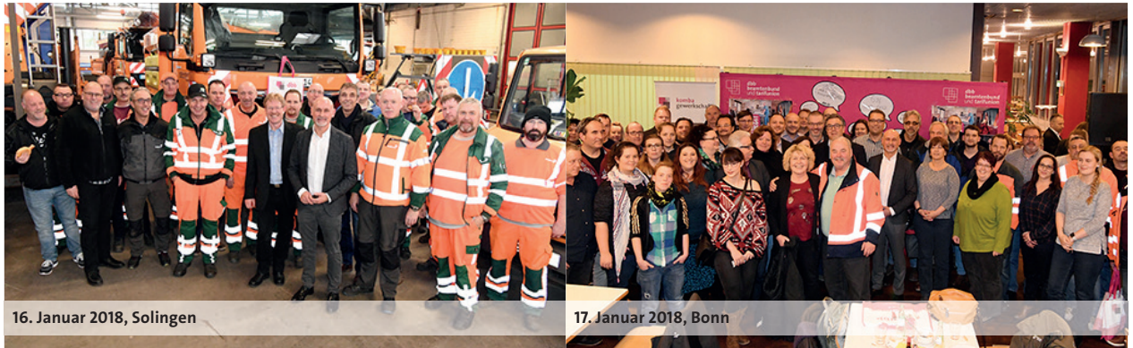
16. Januar 2018, Solingen