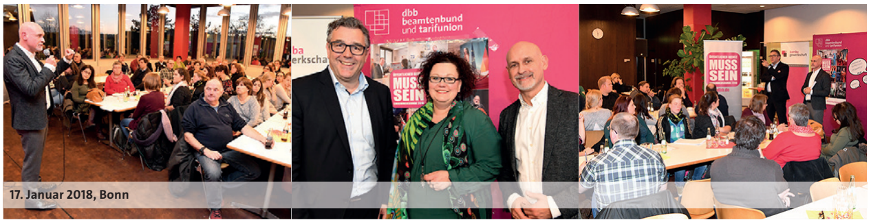
17. Januar 2018, Bonn

schen auf der Flucht wären beispielsweise ohne den besonderen Einsatz der Kolleginnen und Kollegen – oft weit über die eigentlichen dienstlichen Pflichten hinaus – nicht möglich gewesen. Das verdient Anerkennung, und zwar nicht nur in Sonntagsreden, sondern auch ganz praktisch in Form von angemessenen Gehältern und ordentlichen Arbeitsbedingungen. Gerade in der Nachwuchsgewinnung muss etwa die derzeitige Befristungspraxis endlich ein Ende haben.“