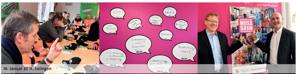
16. Januar 2018, Solingen